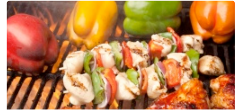
Brochette de carne con vegetales